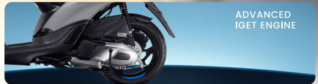
ADVANCED IGET ENGINE