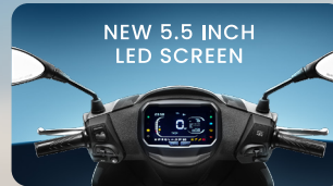
NEW 5.5 INCH LED SCREEN