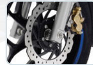
DUAL-CHANNEL ABS SYSTEM