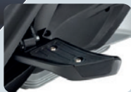
RETRACTABLE PASSENGER FOOTPEGS