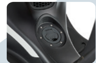
FUEL CAP ON CENTRAL TUNNEL