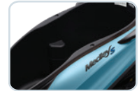
SPACIOUS HELMET COMPARTMENT