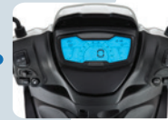
FULL DIGITAL LCD DASHBOARD