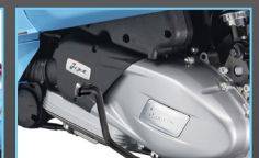
NEW 180CC I-GET ENGINE