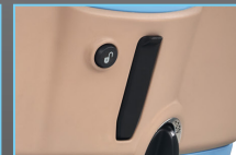
NEW FRONT BAG HOOK