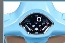
NEW FULL-COLOR LCD DASHBOARD