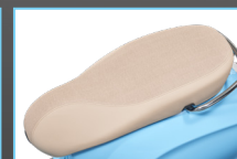
NEW SADDLE MATERIAL AND COLOR