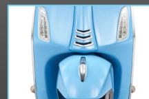
NEW FRONT TIE AND CREST MUDGUARD